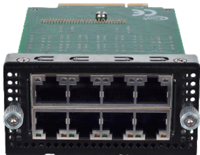
Module cuivre Intel 8x 1GbE